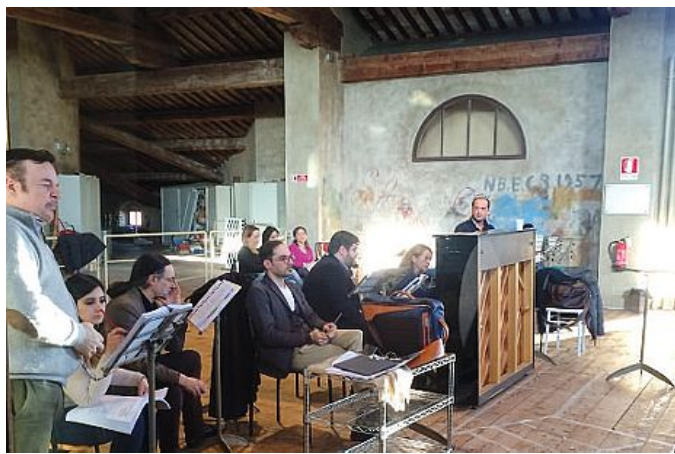
Un momento delle prove del Mefistofele